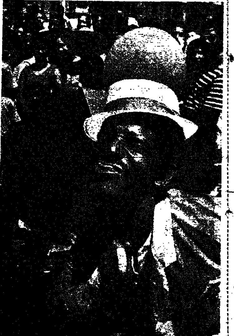
بعد ١٢ سنة من المنع، عادت سلطات افريقيا الجنوبية وسحت باقامة احتفال كرفال كون، في شوارع مدينة الكاب. وقد اشترك في هذا المهرجان مئات المئات والمهجرين الذين راهوا يهزجون ويرقصون، وحياتنا يطلقون حركات سلخنة كما في الصورة.